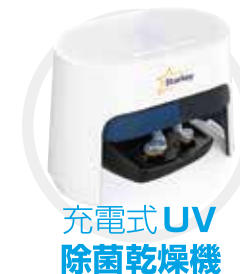
充電式 UV 除菌乾燥機